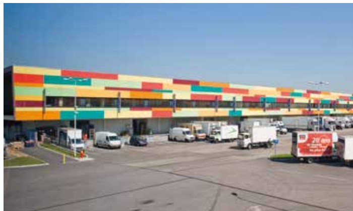
Table é Table & Tablier www.atelier-ttt.com